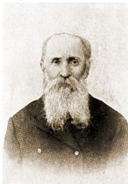
НИКИТА ИСАЕВИЧ ВОРОНИН (1840–1905) Первый русский баптист. Принял крещение 20 августа 1867 г.

Tifliso bendruomenę papildė ir kitų Kaukazo tautų tikintieji. Tarp rusakalbių buvo keletas gabių jaunų žmonių, kurie vėliau tapo žymiais veikėjais Rusijos imperijoje. Vienas iš jų, Vasilijus Pavlovas , buvo pakrikštytas 17 metų.