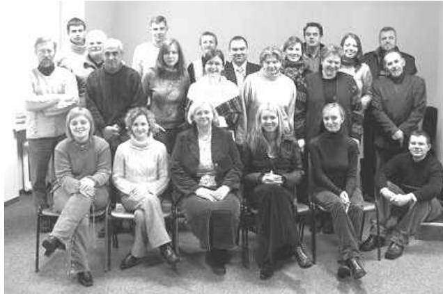
Paskutinis šių metų NEBIM seminaras Vilniuje

Be Diplomo programos seminarų bei sesijų, NEBIM surengė dar du įvykius. Tad lapkričio 19 d. Kauno evangelikų krikščionių baptistų bažnyčioje turėjome konsultaciją, skirtą bažnyčių kasininkams, buhalteriams, tarybų pir-