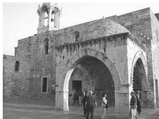
Rytų stiliaus prancūzų katalikų bažnyčia netoli Beiruto

Pagrindinis Federacijos tikslas – savitarpio pagalba. EBF buvo įkurta po Antrojo pasaulinio karo, kad paliudytų karo ir etninės neapykantos nuniokotai Europai, jog Jėzuse Kristuje įmanoma tautų taika ir prasmingas bendrabūvis. Kasmet vis kitoje šalyje susirenka jos taryba. Praėjusiais metais ji buvo susirinkusi Libane, Beiruto mieste. Libano baptistams tai buvo svarbi pagalba parodant, jog bap-