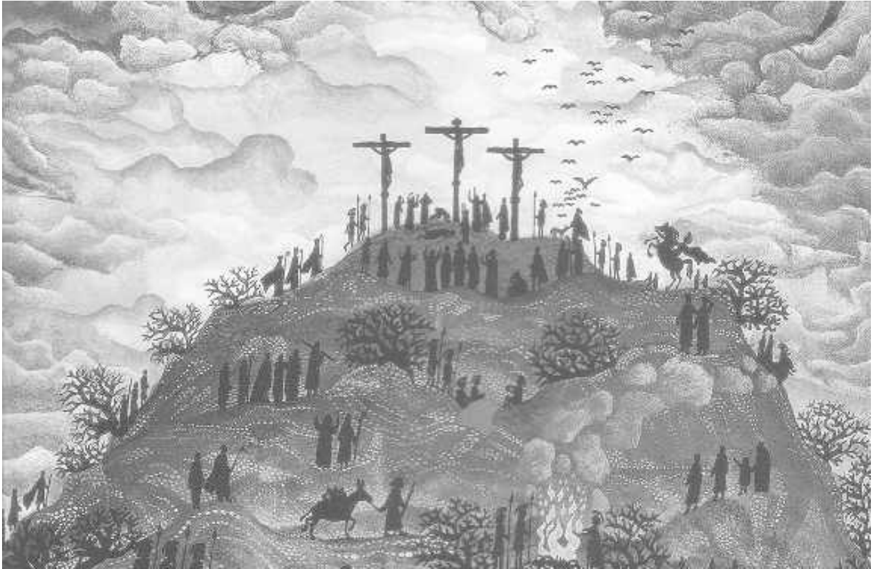
Iliustracija: Esben Hanefelt Kristensen

Jis tarė: „Jėzau, prisimink mane, kai ateisi į savo karalystę!“ Jėzus jam atsakė: „Iš tiesų sakau tau: šiandien su manim būsi rojuje.“