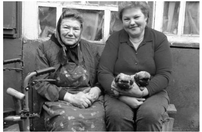
Ylakių bendruomenės seserys

O birželio 9-10 dienomis beveik visi nebimiečiai, o ir laisvi klausytojai susirinkome vienoje mažesnių mūsų bendruomenių – Ylakiuose. Biblijos mokyklos seminaras šioje, nuo įkūrimo skaičiuojančioje jau daugiau nei 100 metų, bendruomenėje vyko pirmą kartą. Džiaugėmės vienas kito bendryste, šiltu ylakiškių priėmimu (ačiū jiems ir mažeikiškiams už rū-